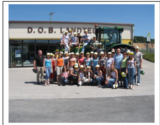
Обучающиеся бакалавриата и магистратуры в Университете Вайенштефан-Триздорф

В рамках той же программы преподаватели кафедры управления и маркетинга, наряду с другими сотрудниками ВГАУ регулярно проходят повышение квалификации в Университете Вайенштефан по программам «Аграрный менеджмент» и «Экономика сельских территорий».