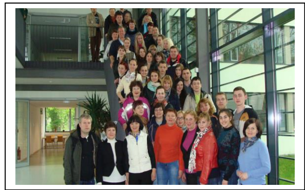
Преподаватели и обучающиеся на лекциях курсов повышения квалификации в Университете Вайенштефан-Триздорф

Сотрудничество по программе не ограничивается лишь Университетом Вайенштефан. Так, за последние годы сотрудники кафедры управления и маркетинга в АПК имели возможность посетить и принять участие в программах повышения квалификации и научно-практических конференциях в партнерских вузах Венгрии, Армении, Италии, Чехии и других стран.