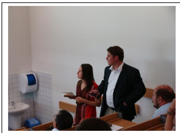
Лекция для слушателей Воронежского ГАУ в Университете естественных наук, г. Прага