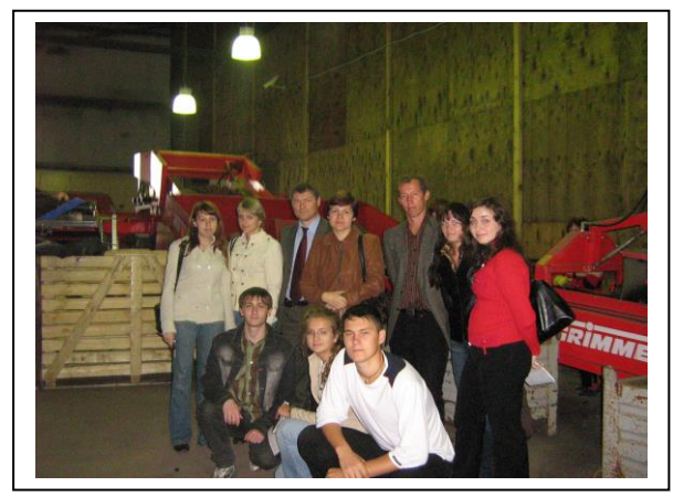
Преподаватели и обучающиеся на ознакомительных экскурсиях у немецких фермеров