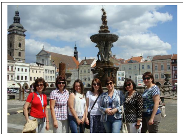
Преподаватели кафедры во время ознакомительной поездки по Чехии